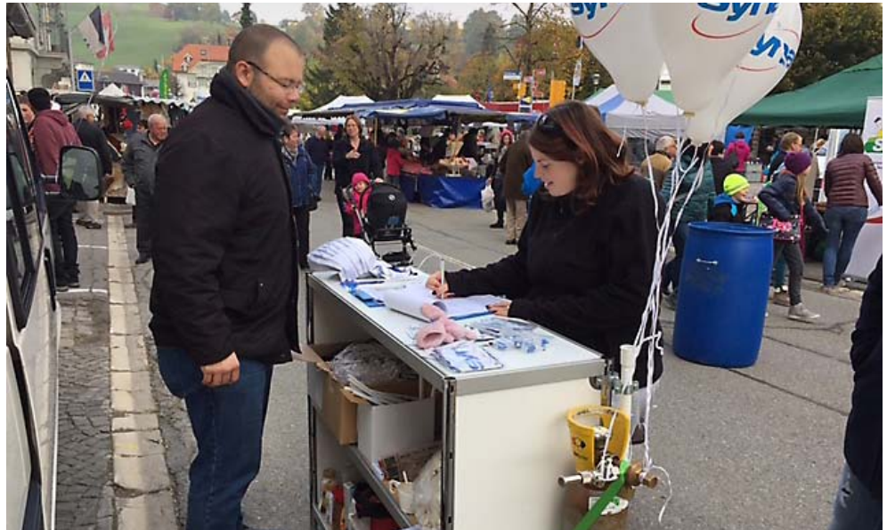
Plaffeienmärit 2015: Das Syna-Team engagiert sich bei der Unterschriftensammlung für die Konzernverantwortungsinitiative.

Im September 2015 informierte die Geschäftsleitung der Wifag-Polytype in Freiburg über einen erneuten Stellenabbau